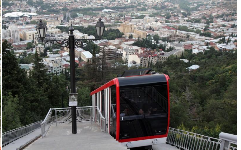
ค่ำ อีศระอาหารค่ำ ณ ภัตตาคารบนเขา ทัดสมีนด้า พักค้างแรม ณ โรงแรม Ramada Encore Tbilisi (4*) หรือในระดับเดียวกัน